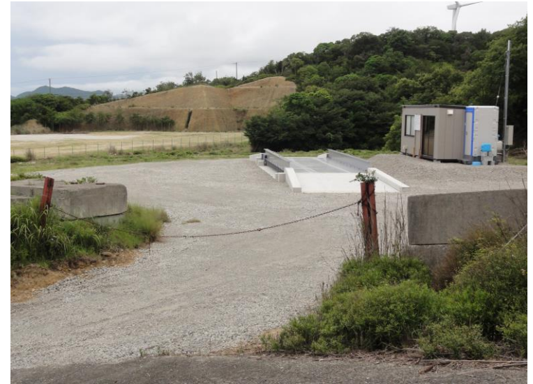
進入口付近(市道:東町地野線⇄阿万6号線)